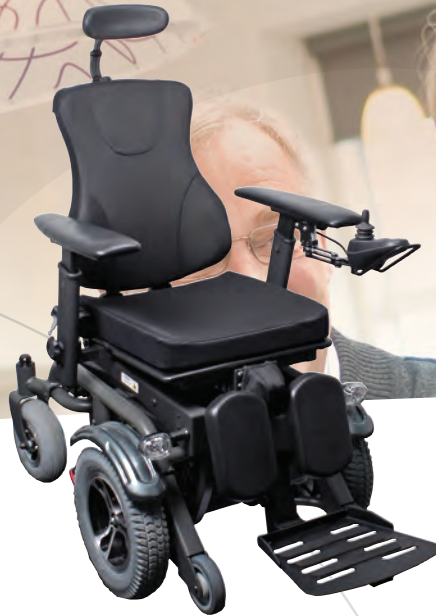
VELA Blues 1100 forhjulstrukken