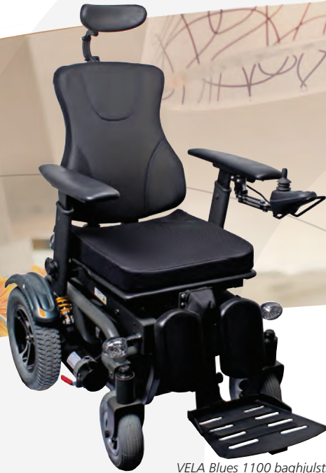
VELA Blues 1100 baghjulstrukken