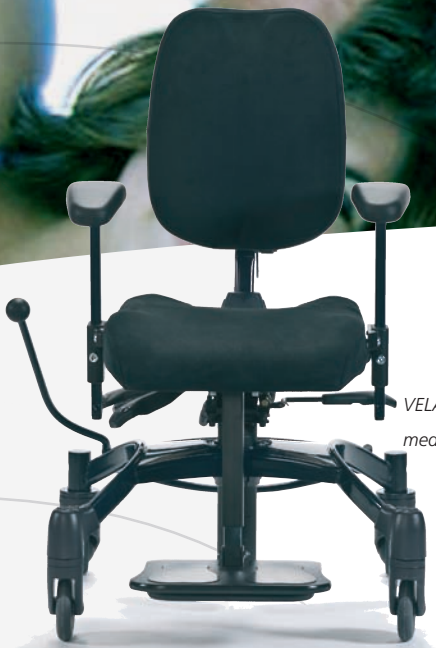
VELA Tango 100S med gas højderregulering