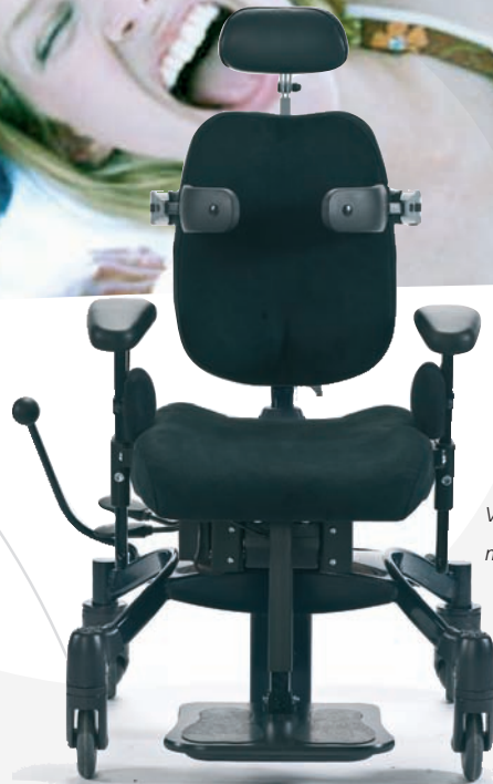
VELA Tango 100ES med el-højderregulering

VELA Tango 100ES/S er en fremtidssikker stol til skole og hjem for børn og unge med specielle behov. Stolen giver en høj grad af stabilitet og sikkerhed i flot forening med et højt fokus på ergonomi.