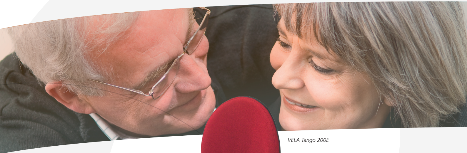
VELA Tango 200E

TIL PERSONER MED BEHOV FOR EKSTRA STØTTE