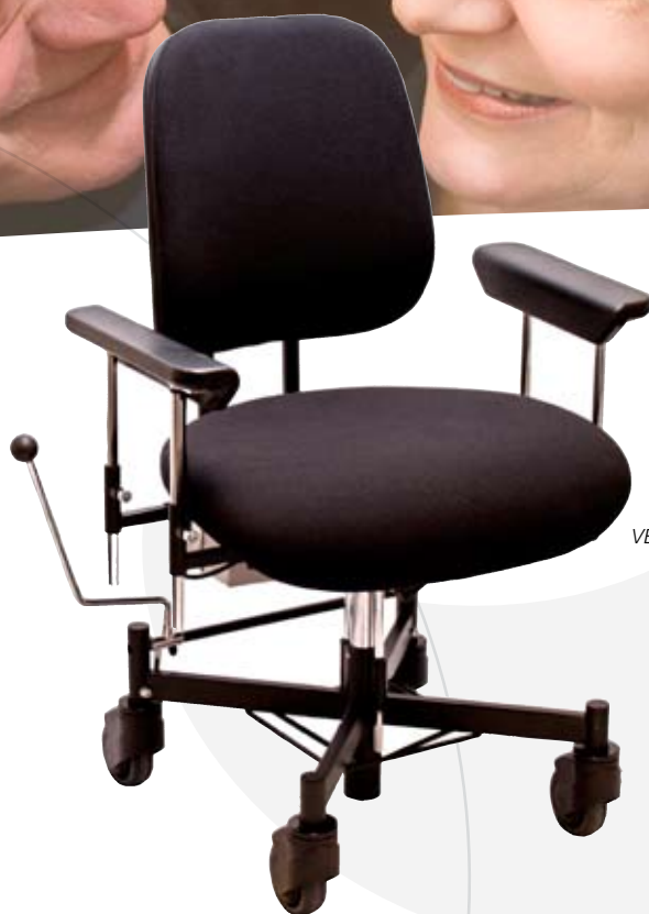
VELA Tango 300