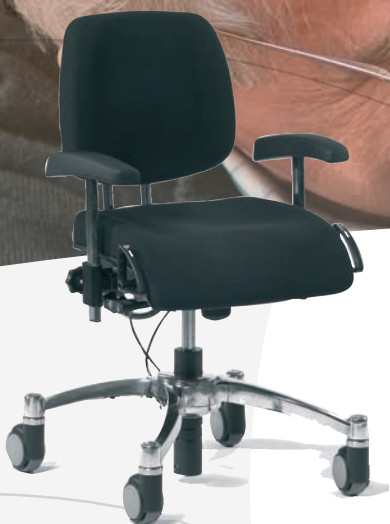
VELA Tango 400 - stol til ældre, gangbesværet eller kraftige personer