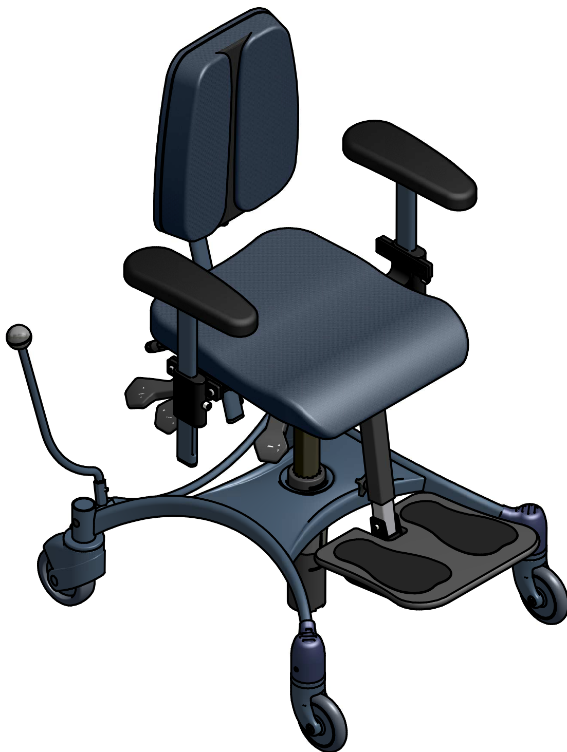
VELA Tango 100 S