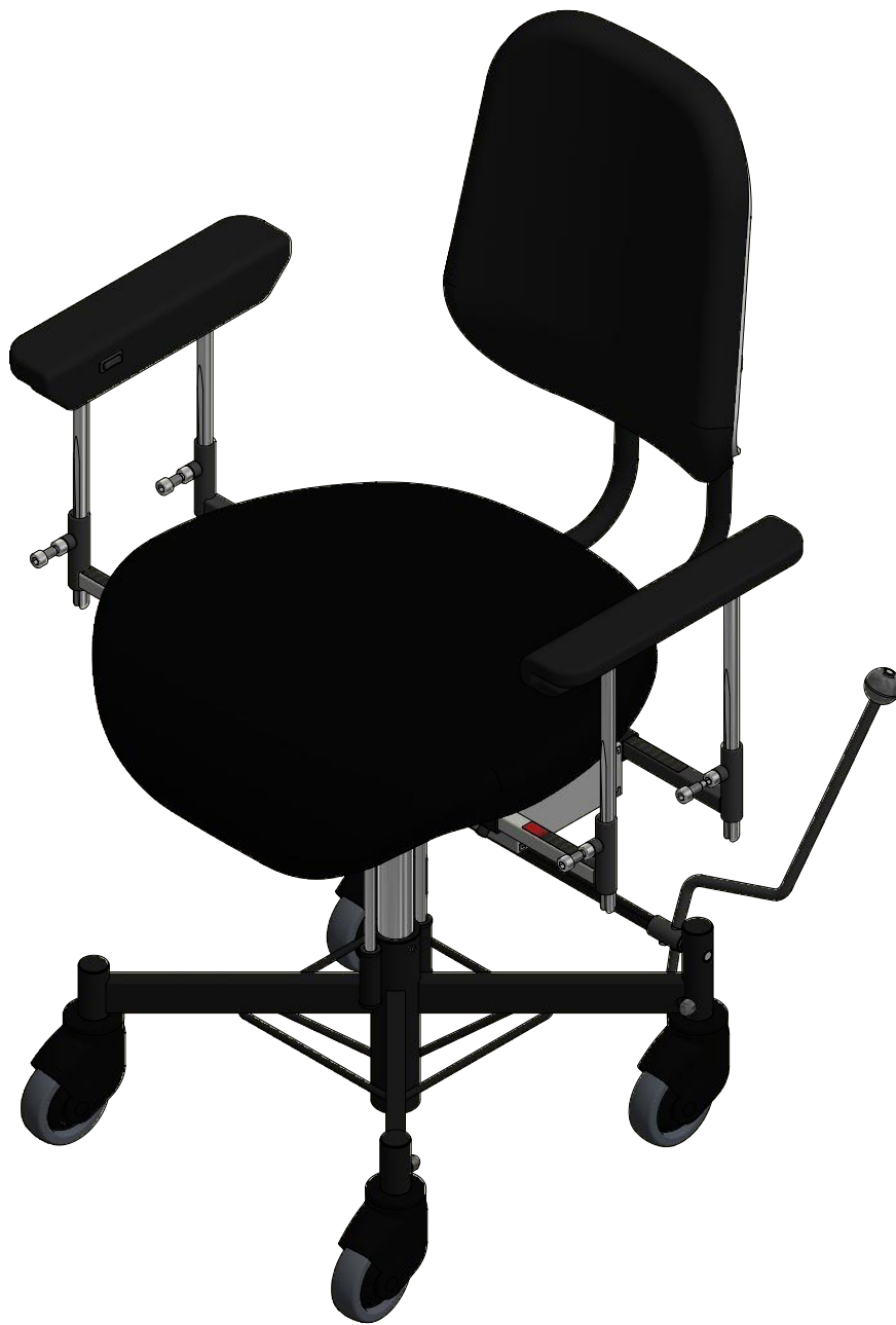
VELA Tango 300E