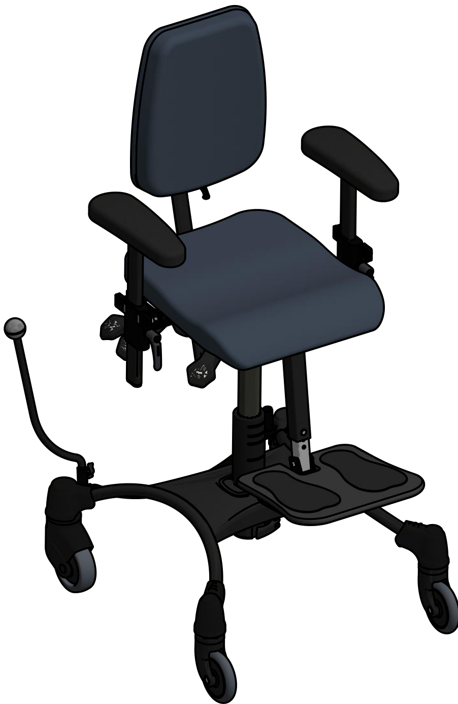
VELA Tango 100 S