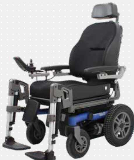
VELA Sango med baghjulstræk

Stolen kan komme rundt på smalle steder og der er plads til 90° vinkling af benene.