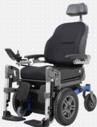
VELA Sango med forhjulstræk

Stolen kan komme rundt på smalle steder og der er plads til 90° vinkling af benene.