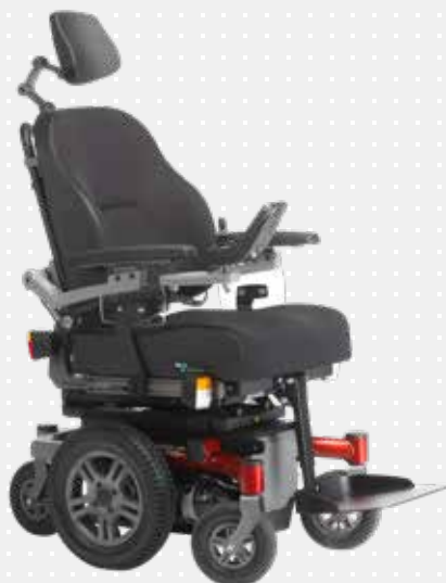
VELA Sango Slimline - centerdrev

Drejer om sin egen akse, hvilket gør den nem at manøvrere på begrænset plads.