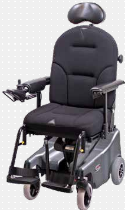
Blues 100 med Comfort I-sæde og -ryg

Ergonomisk, polstret rygpude og sæde er velegnet til brugere, der har behov for god støtte og komfort. Ekstra skum indbygget i hver side af puden sikrer brugeren en behagelig sidestøtte. Rygpuden har lynlås, så det er muligt at indlægge kiler efter behov. En indbygget gjordebund i sædet sikrer brugeren god trykaflastning ved langvarigt brug. Pudene er lavet i et strækbart stof, der øger komforten.