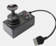
Ledsagerstyring - VR2