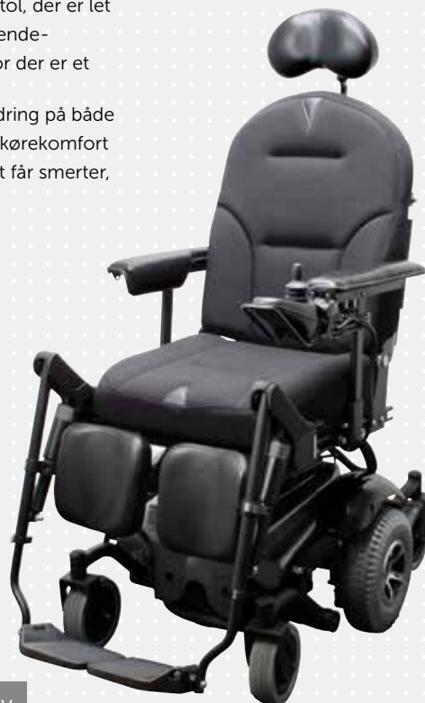
Blues 210 med centerdrev

VELA Blues 210 er en kompakt, all-around el-kørestol, der passer til de flestes behov – også brugeren, der har en aktiv livsstil, med fx arbejde, skole eller uddannelse. Den er velegnet til kombineret inde- og udebrug, da stolens affjedring sikrer komfort og gode køreegenskaber i jævnt terræn. Stolen er centerdrevet, hvilket giver den en stor fordel på steder med minimal plads.