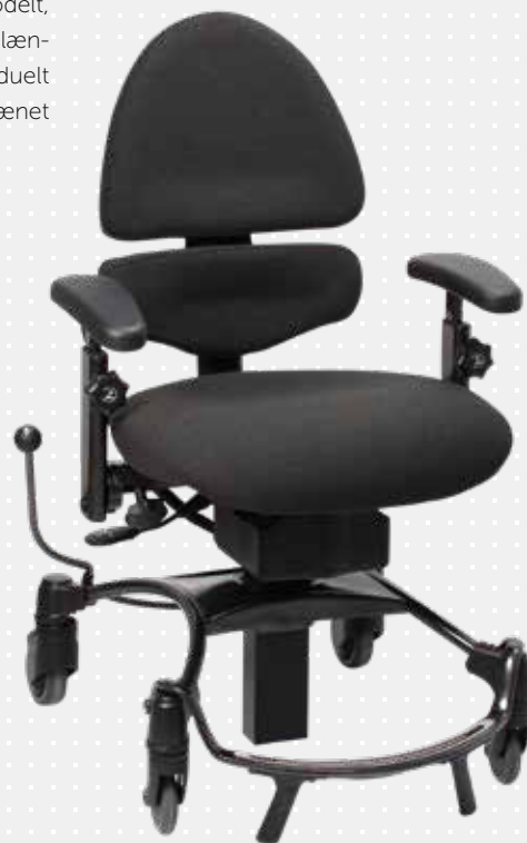
VELA Tango 500EI med medium ALB-ryglæn

VELA Tango 500 er den nyeste udvikling indenfor arbejdsstole, som udover arbejdsstolens velkendte fordele, har et revolutionerende, todelt ALB-ryglæn. ALB-ryglænet understøtter i høj grad en aktiv, varieret, ergonomisk siddestilling for mennesker med funktionsnedsættelser, som har brug for ekstra komfort, støtte og sikkerhed. VELA Tango 500 bidrager dermed til mobilitet, aktivitet og deltagelse i hverdagen eller på jobbet, på trods af funktionsnedsættelse.