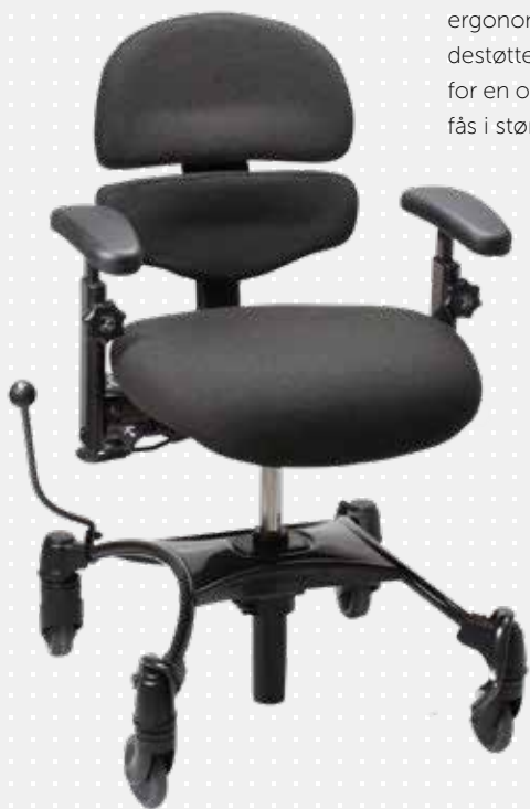
VELA Tango 500 med small ALB-ryglæn

Active Lumbar Backrest (ALB) er et unikt todelt, ergonomisk formet ryglæn. Det består af en lændestøtte og en rygstøtte, der indstilles individuelt for en optimal støtte af lænd og ryg. ALB-ryglænet fås i størrelserne small, medium og large.