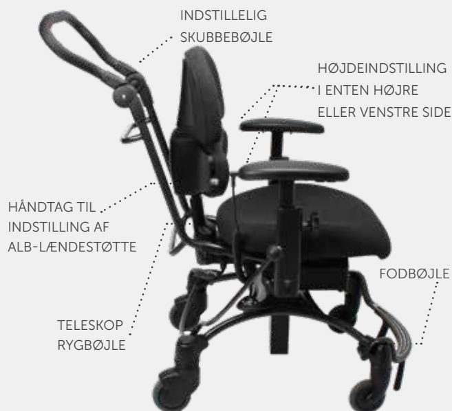
VELA Tango 500EI med tilbehør

Afsættet for ALB-ryglænet er, at selv små bevægelser og ændringer i ryggen giver variation og øget muskelaktivitet i muskel-korsettet omkring mave, lænd og bækken. Disse ændringer kan bevirke, at man ikke bliver træt i ryggen og ikke sidder og falder sammen.