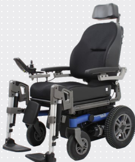
VELA Sango med baghjulstræk

Stolen kan komme rundt på smalle steder og der er plads til 90° vinkling af benene.