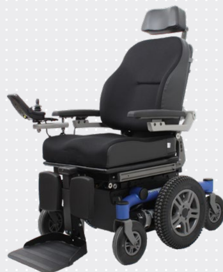
VELA Sango med centerdrev

Stolen er meget retningsstabil ved høj fart.