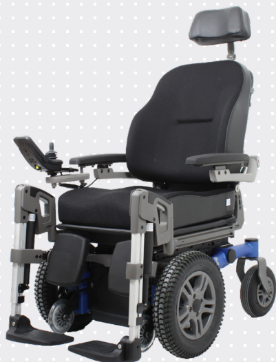
VELA Sango med forhjulstræk

Stolen kan komme rundt på smalle steder og der er plads til 90° vinkling af benene.