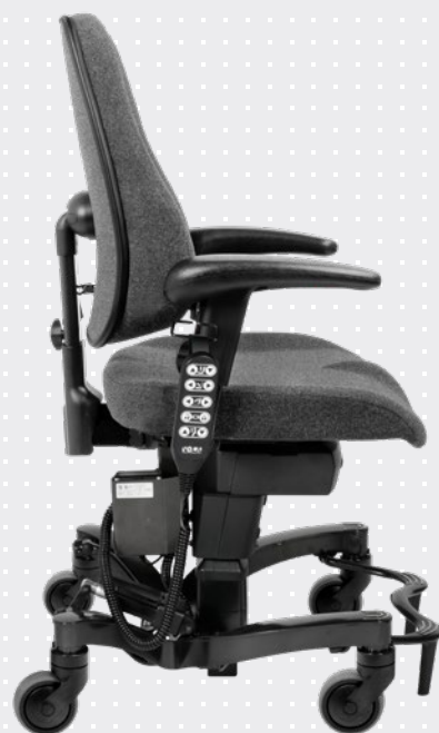
VELA Tango 700E