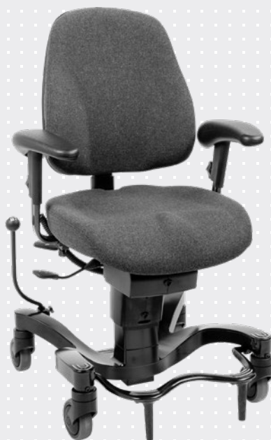
VELA Tango 700E