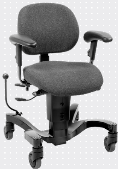
VELA Tango 700